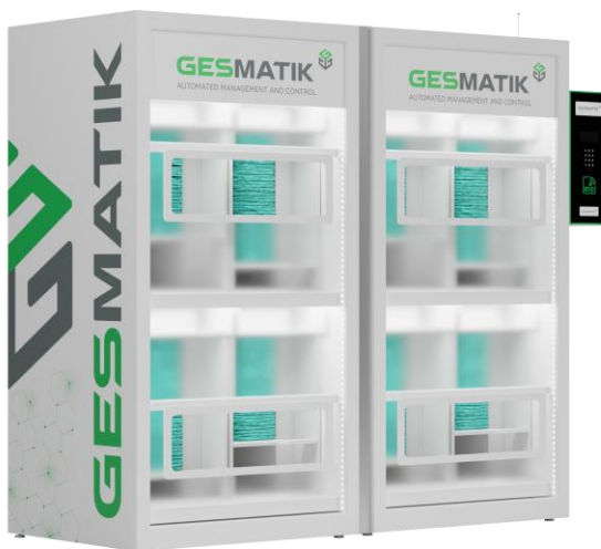
En la imagen, configuración de 8 selecciones