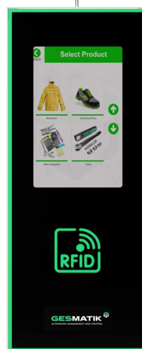
Mc Next Touch